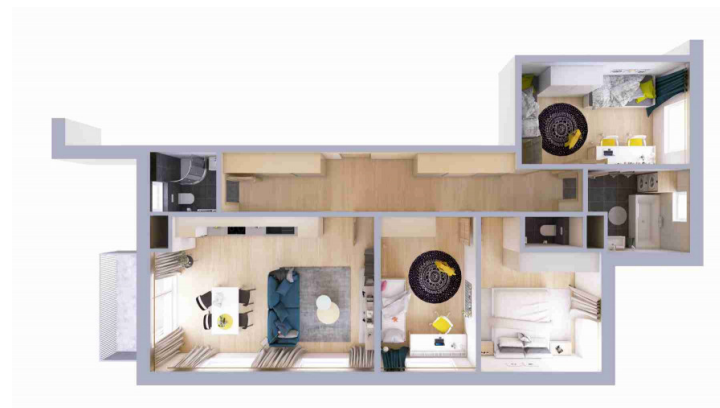
Schéma půdorysu bytu představuje dispoziční řešení bytu.