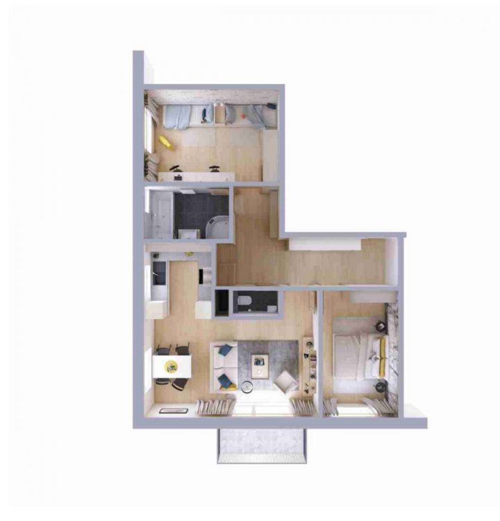
Schéma půdorysu bytu představuje dispoziční řešení bytu.