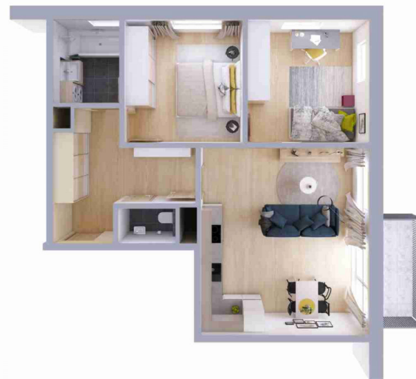
Schéma půdorysu bytu představuje dispoziční řešení bytu.