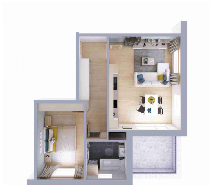
Schéma půdorysu bytu představuje dispoziční řešení bytu.