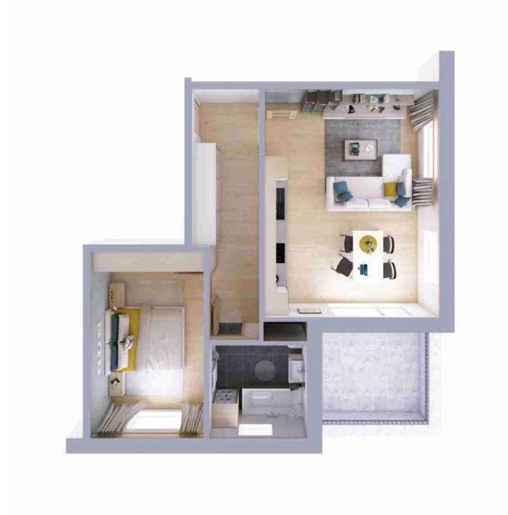
Schéma půdorysu bytu představuje dispoziční řešení bytu.