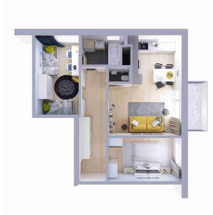
Schéma půdorysu bytu představuje dispoziční řešení bytu.