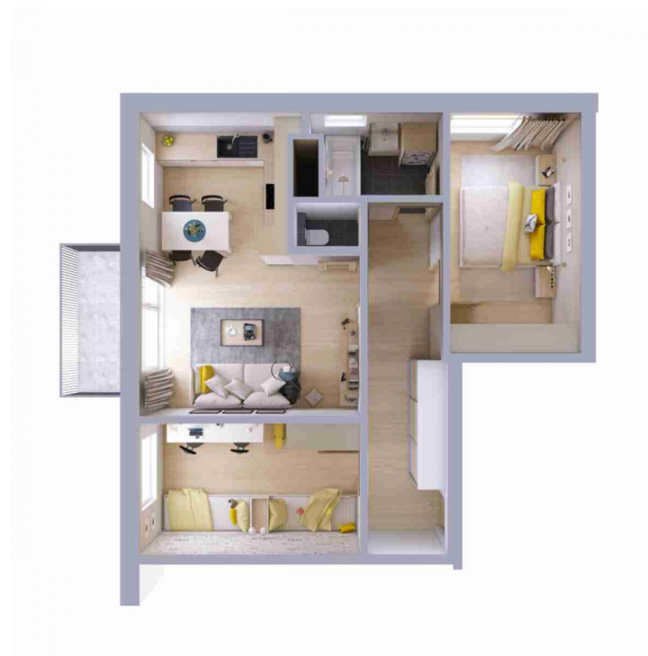
Schéma půdorysu bytu představuje dispoziční řešení bytu.