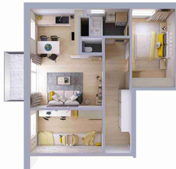
Schéma půdorysu bytu představuje dispoziční řešení bytu.