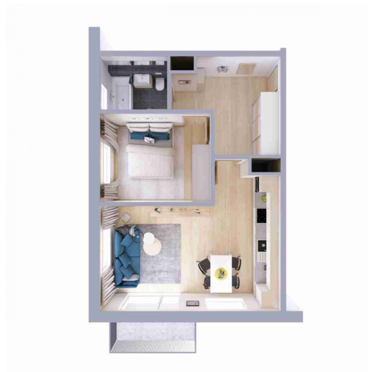
Schéma půdorysu bytu představuje dispoziční řešení bytu.