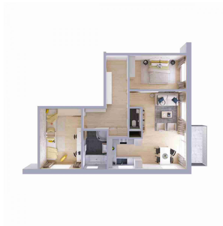
Schéma půdorysu bytu představuje dispoziční řešení bytu.