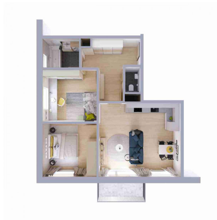
Schéma půdorysu bytu představuje dispoziční řešení bytu.