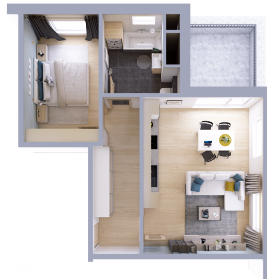
Schéma půdorysu bytu představuje dispoziční řešení bytu.