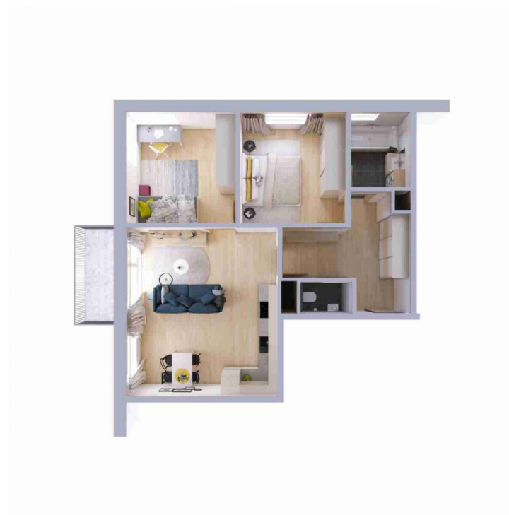
Schéma půdorysu bytu představuje dispoziční řešení bytu.