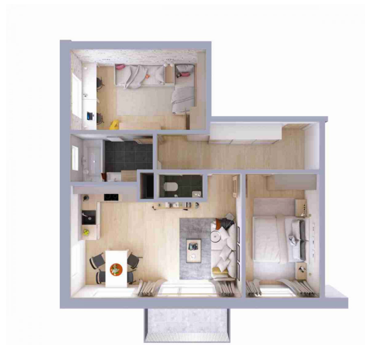
Schéma půdorysu bytu představuje dispoziční řešení bytu.