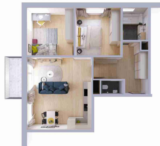
Schéma půdorysu bytu představuje dispoziční řešení bytu.