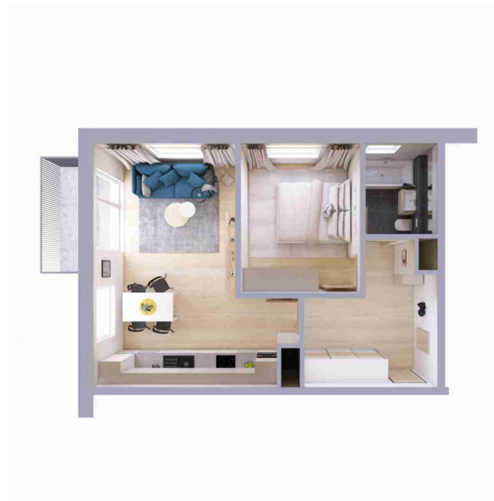
Schéma půdorysu bytu představuje dispoziční řešení bytu.