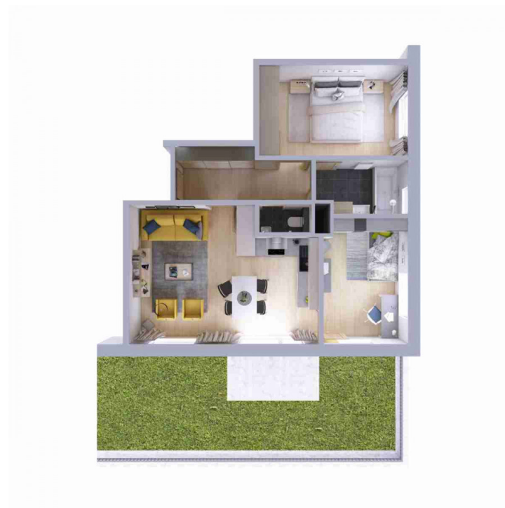
Schéma půdorysu bytu představuje dispoziční řešení bytu.