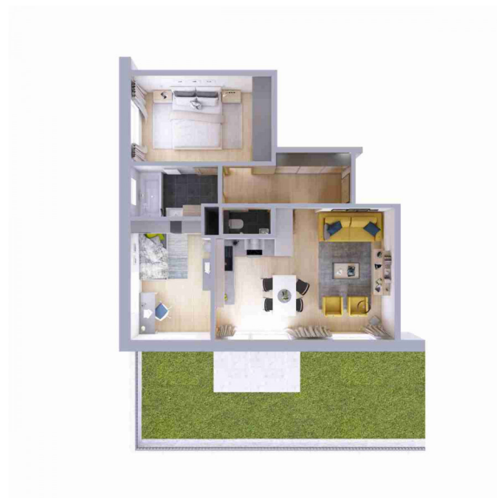
Schéma půdorysu bytu představuje dispoziční řešení bytu.