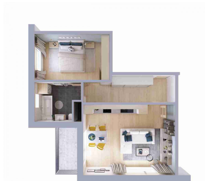
Schéma půdorysu bytu představuje dispoziční řešení bytu.