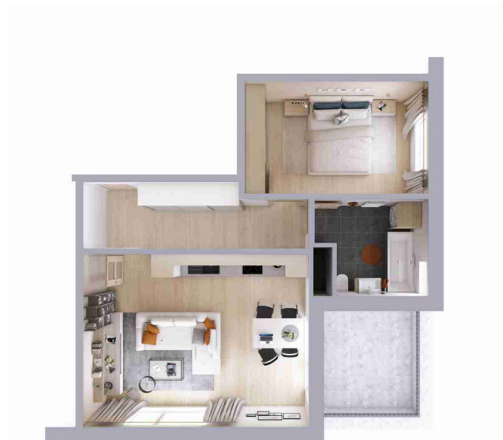
Schéma půdorysu bytu představuje dispoziční řešení bytu.